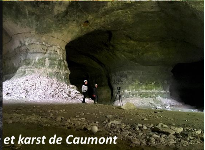
Carrière souterraine et karst de Caumont