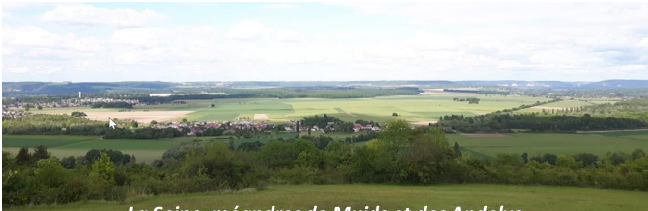
La Seine, méandres de Muids et des Andelys